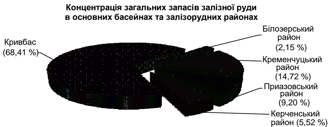
Рис. 1. Територіальний розподіл запасів залізорудної сировини України

Високоякісні залізні руди відкрито також у чисельних окремих родовищах, серед яких виділяють Вовчанське (північ Харківської області, в межах південного схилу Воронезького кристалічного масиву, де ці руди, очевидно, пов'язані з Курською магнітною аномалією) та Матуське (Донецька область). Запаси залізної руди виявлено також у Закарпатті, у верхів'ї річки Прут, але нині вони не мають господарського значення як через низький вміст заліза (4–16 %), так і за кількісними параметрами. На особливе місце заслуговує Керченський залізорудний район, де розташовано близько 1 млрд т бурих залізняків. На рис. 1 наведено розподіл головних запасів залізорудної сировини України за географічним розташуванням [7].