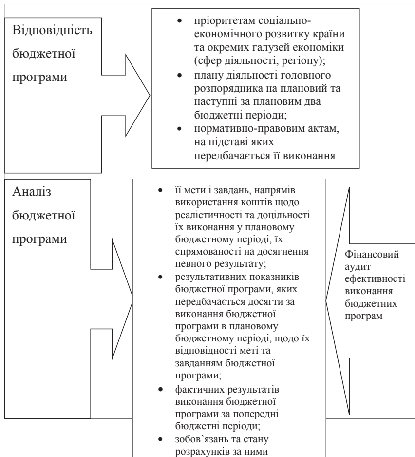
Рис. 3. Оцінка ефективності бюджетної програми