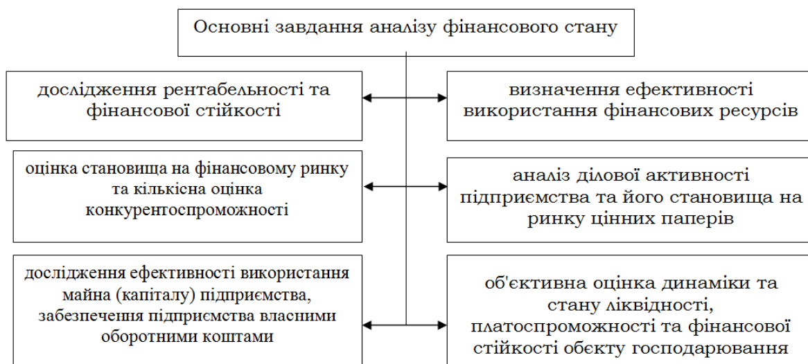
Рис. 2. Завдання аналізу фінансового стану підприємства

призводить до низької платоспроможності підприємства і, як наслідок, до можливих перебоїв у постачанні, виробництві та реалізації продукції; до невиконання плану прибутку, зниження рентабельності підприємства, до загрози економічних санкцій. Основні завдання аналізу фінансового стану підприємства наведено на рис.2.