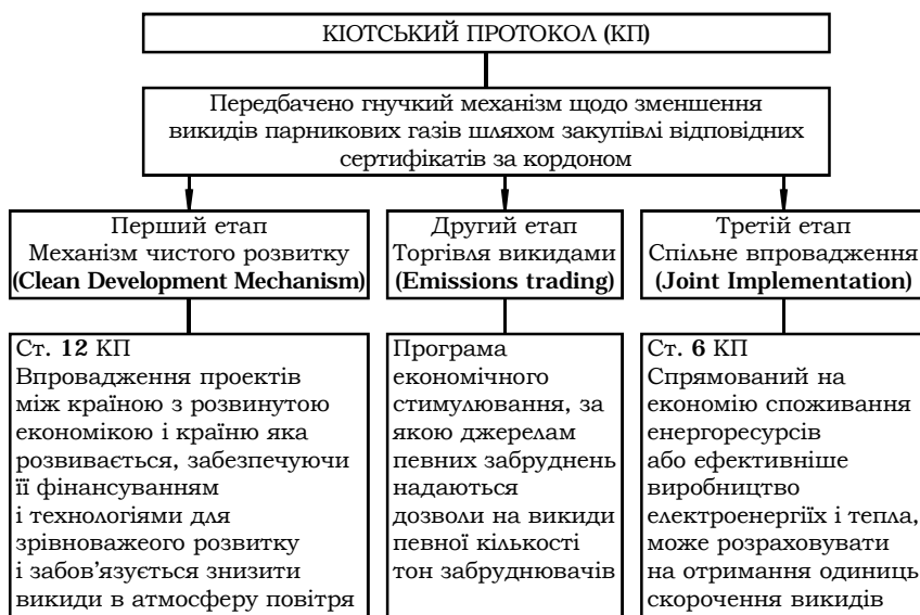
Рис.2. Механізм дії Кіотського протоколу*

запобігання негативного впливу господарської діяльності на навколишнє середовище із збереженням екологічної безпеки на державному рівні. Законом України передбачено створення державної системи моніторингу довкілля і проведення спостережень за станом навколишнього природного середовища, рівнем його забруднення. Виконання цих функцій покладено на Міністерство екології та природних ресурсів України та інші центральні органи виконавчої влади, які є суб'єктами державної системи моніторингу довкілля, а також підприємства, установи і організації, діяльність яких призводить або може призвести до погіршення стану довкілля [2].