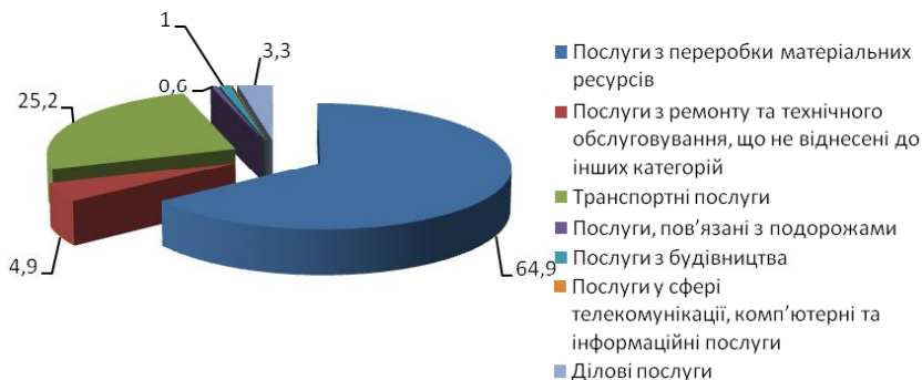
Рис. 1. Структура експорту торгівлі послугами у Миколаївській області за 2013 р., %*

Структура українського експорту послуг протягом тривалого часу залишається майже незмінною (рис. 1).