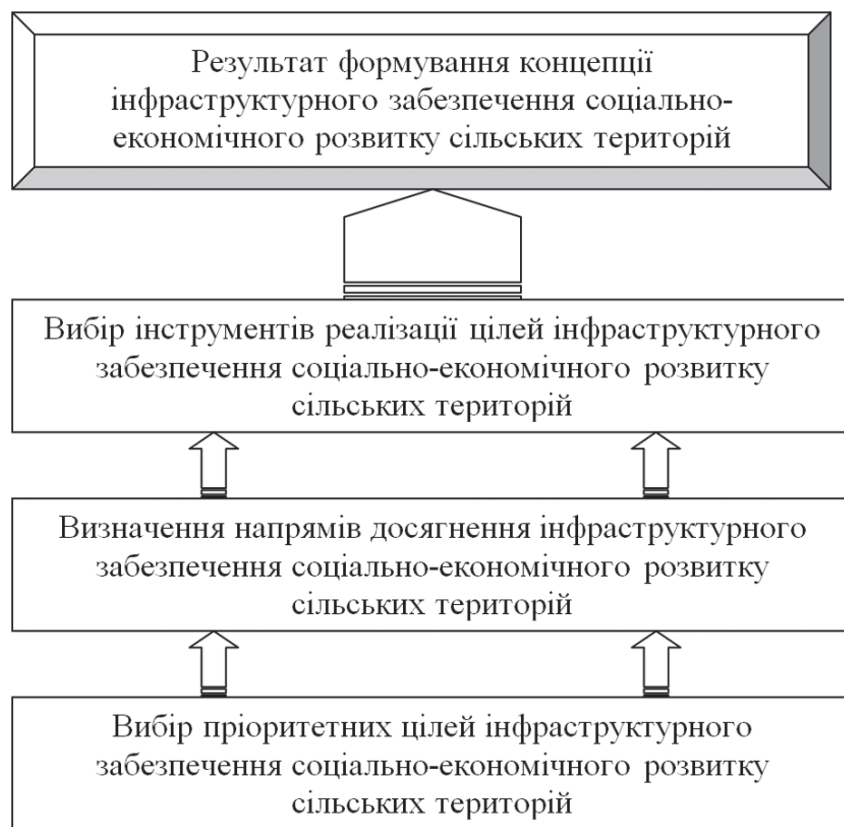
Рис. 1. Етапи формування концепції інфраструктурного забезпечення соціально-економічного розвитку сільських територій

Під формуванням концепції інфраструктурного забезпечення соціально-економічного розвитку будемо розуміти взаємозалежну і взаємодіючу сукупність і послідовність дій суб'єктів господарювання, методів та інструментів регіональних і державних органів влади з метою реалізації поставлених цілей і програм транскордонного рівня. На нашу думку, цей процес має складатися з певних елементів (рис. 1).