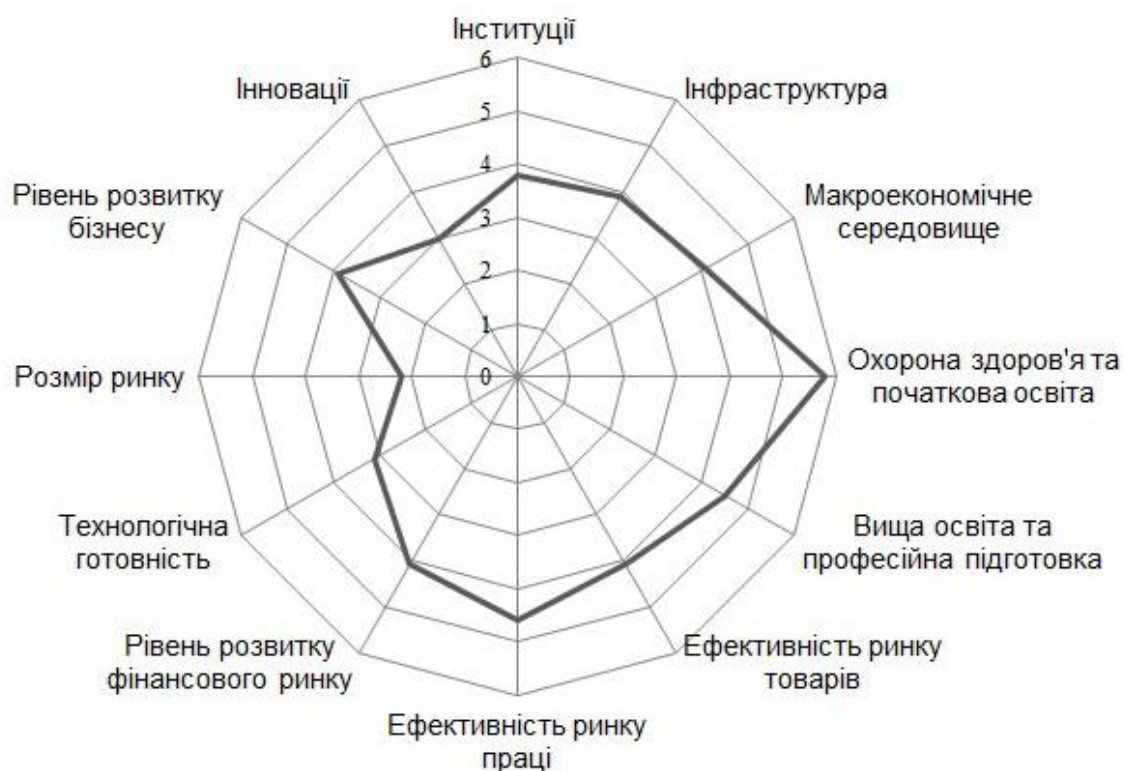
Рис. 3. Пріоритетність складових індексу глобальної конкурентоспроможності регіонів України за середнім значенням (третій етап дослідження)

тровській, Львівській та Київській областях. Найменші позиції посідають Житомирська, Херсонська та Кіровоградська області. Регіональні особливості є вагомою передумовою у прийнятті рішень та повинні бути зорієнтовані на основні макроекономічні категорії: чисельність населення регіону, валовий регіональний продукт, валовий регіональний продукт у розрахунку на одну особу, питома вага регіону у формуванні ВВП країни (рис. 3).