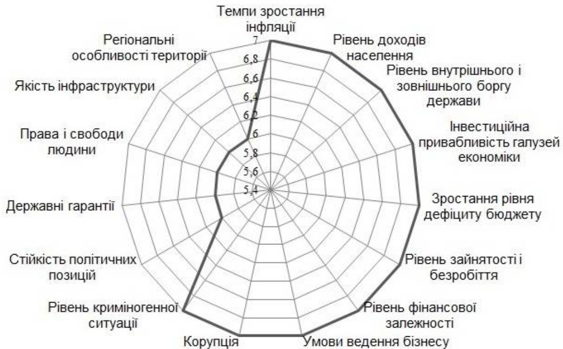
Рис. 2. Пріоритетність чинників впливу за результатами експертної оцінки (другий етап дослідження)

сферах економіки держави та на усіх агрегованих ринках, що потребує їхньої постійної оцінки та запровадження відповідних дій з метою нейтралізації негативних тенденцій, своєчасної адаптації на усіх рівнях управління.