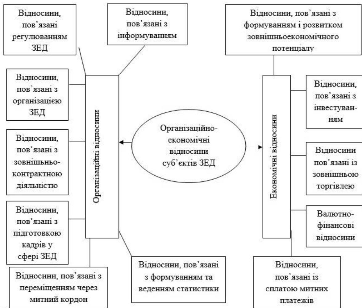
Рис.1. Організаційно-економічні відносини суб'єктів зовнішньоекономічної діяльності

Виклад основного матеріалу. Організаційно-економічні відносини є відображеними у господарських системах окремих галузей суспільного виробництва – економіка промисловості, сільського господарства, торгівлі, охорони здоров'я тощо. Їхню специфіку вивчають конкретні економічні науки. До загальних організаційно-економічних відносин належать форми і методи господарювання, які характерні для всіх галузей економіки. Серед останніх сьогодні виділяють, по-перше, ринкову систему, в центрі якої – товарно-грошові відносини; по-друге, підприємництво, засноване на ефективному веденні господарства. Загальні організаційно-господарські відносини – це відносини у сфері грошового обігу, ціноутворення, фінансів, кредиту, маркетингу, менеджменту, біржової справи тощо.