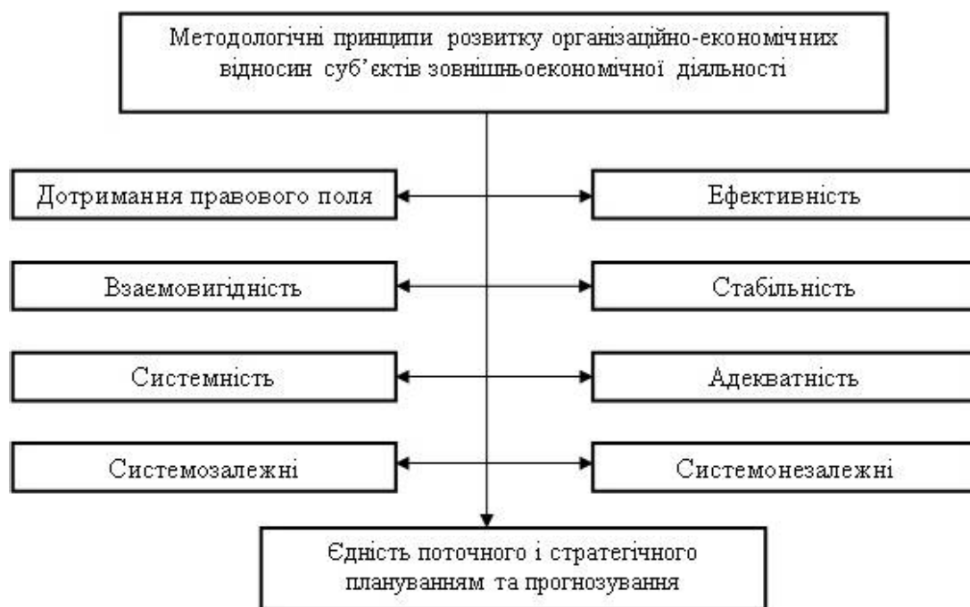
Рис. 2. Методологічні принципи розвитку організаційно-економічних відносин суб'єктів зовнішньоекономічної діяльності

ня суб'єктів зовнішньоекономічної діяльності. Методологічні принципи розвитку організаційно-економічних відносин аграрних підприємств суб'єктів зовнішньоекономічної діяльності зосереджено на рисунку 2.