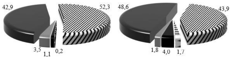
Рис. Вплив досліджуваних чинників на врожайність зерна пшениці м'якої озимої сорту Астет за роками

Умовні позначення: ■ – чинник А; ▨ – чинник В; ▩ – взаємодія АВ; ■ – повторення; ■ – помилки. Попередники: I – чистий пар; II – гречка