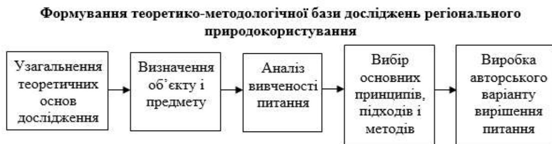
Рис. 2. Другий етап досліджень антропогенного впливу на ландшафти Запорізької області

території природно-заповідного фонду – 1 (1), ліси – 2 (1,05), болота і заболочені землі – 3 (1,1), луки – 4 (1,15), сади та виноградники – 5 (1,2), рілля – 6 (1,25), сільська забудова – 7 (1,3), міська забудова – 8 (1,35), ставки, водосховища і канали – 9 (1,4), землі промислового використання – 10 (1,5).