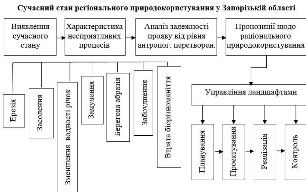
Рис. 4. Четвертий етап досліджень антропогенного впливу на ландшафти Запорізької області

Загальна закономірність полягає в тому, що чим більша площа виду природокористування і вищий індекс глибини перетвореності ландшафтів, тим більшою мірою ландшафт змінюється під впливом господарської діяльності. Показник, наближений до 10, свідчить про глибоку антропогенну перетвореність, а ближчий до 1 – про низький рівень її перетвореності.