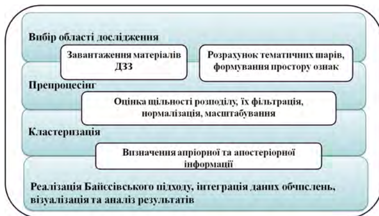
Рис. 1. Функціональна схема реалізації класифікатора на основі вирішального правила Байєса

У центральній частині області дослідження (Полтавська область) поширені поклади вуглеводнів в пастках структурного класу (склепінні, тектонічно-екрановані), що обумовлює вибір саме цієї території для прогнозування потенційно перспективних структурних форм.