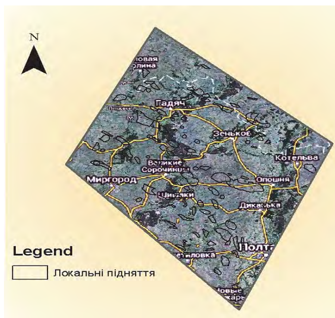
Рис. 2. Розподіл об'єктів навчальної множини (відомих тектонічних підняття) в межах області дослідження