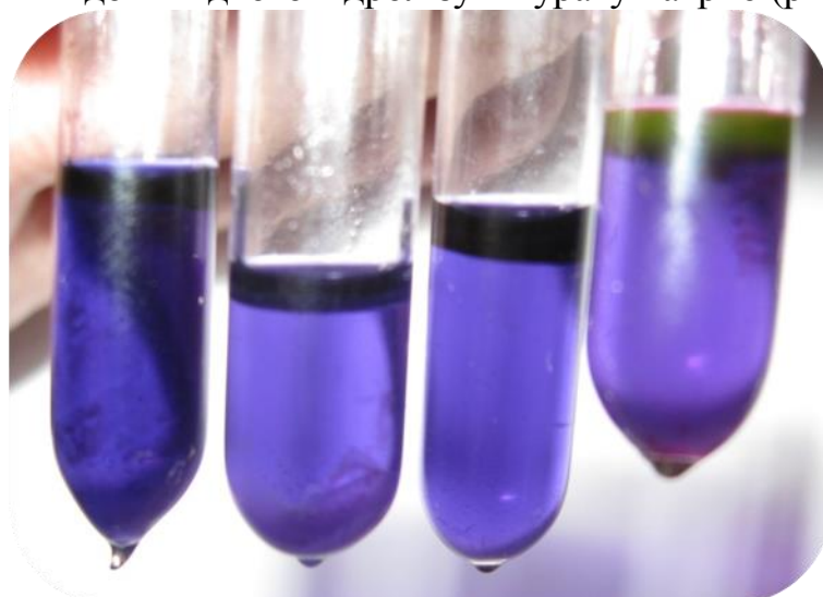
Рис. 1. Позитивна реакція гідролізу-1 гіпурату натрію ізолятами C. jejuni

чутливими до брильянтової зелені у розведенні 1: 100000. Основна ознака, за якою диференціювали C. jejuni від інших кампілобактерій – здатність досліджуваних ізолятів до швидкого гідролізу гіпурату натрію (рис. 1).