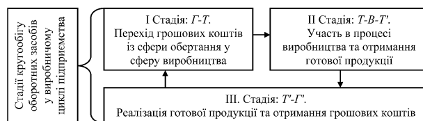
Рис. 1. Кругообіг оборотних засобів протягом виробничого циклу

Органічна єдність трьох стадій кругообігу оборотних засобів є класичним виразом виробничого циклу, що має головну ціль — відшкодування виробничих запасів та забезпечення відтворювального процесу (рис. 1).