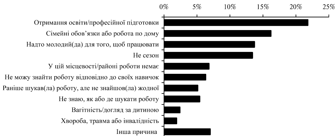
Рис. 4. Причини економічної неактивності молоді

особи у віці 15–19 років — 49,3 %, міські жителі — 67,8 %. Здійснено аналіз причин економічної неактивності молоді в 2013 році на сучасному ринку праці (рис. 4 [7]).