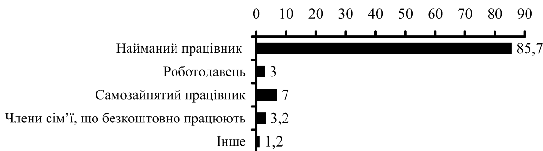
Рис. 1. Питома вага зайнятої молоді в загальній структурі зайнятих, %

проблеми — підвищення економічної активності молоді. Розглянемо основні характеристики зайнятості молоді. За даними статистики [4], в 2013 році рівень зайнятості в Україні серед осіб віком від 15 до 35 років становив 33,1 % до середньоблікової чисельності штатних працівників, у тому числі серед жінок — 32,5 %. У цілому 44,7 % молоді є зайнятими в різних сферах економічної діяльності (50,5 % молодих чоловіків і 38,8 % молодих жінок). Найвищий рівень зайнятості спостерігається серед старшої вікової групи — 25–29 років (59,4 %), тоді як у наймолодшій групі (15–19 років) цей показник становить 5,5 %. Майже 70 % всіх найманих працівників працюють на приватних підприємствах (серед жінок цей показник є дещо нижчим). Розглянемо питому вагу зайнятої молоді в загальній структурі зайнятих (рис. 1, станом на 01.01.2014 року [5]).