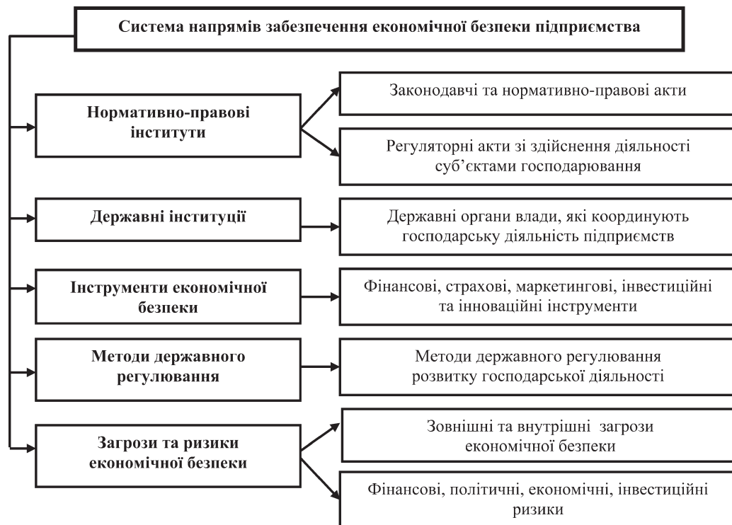
Рис. 2. Напрями інституціонального забезпечення економічної безпеки промислового підприємства

Висновки. У результаті проведеного дослідження визначено напрями інституціонального забезпечення економічної безпеки промислового підприємства, де має бути механізм регулювання діяльності підприємства; забезпечення інформаційної безпеки його роботи; висока фінансова ефективність, незалежність та стійкість функціонування підприємства.