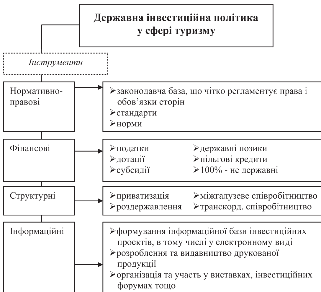
Рис. 2. Основні інструменти державної інвестиційної політики у сфері туризму [2]

у сфері туризму. Цей інструмент дає змогу сформувати електронну базу інвестиційних проєктів у сфері туризму, забезпечити он-лайн тендер на прозорих умовах, виробити механізм сталого розвитку інвестиційних проєктів на досвіді минулих років.