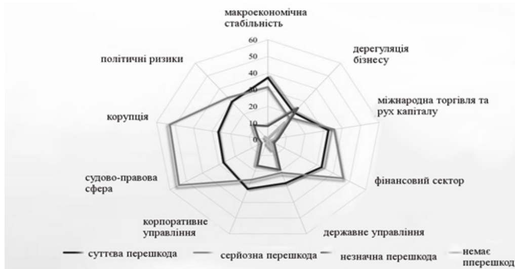
Рис. 3. Основні ризики для інвесторів в Україні