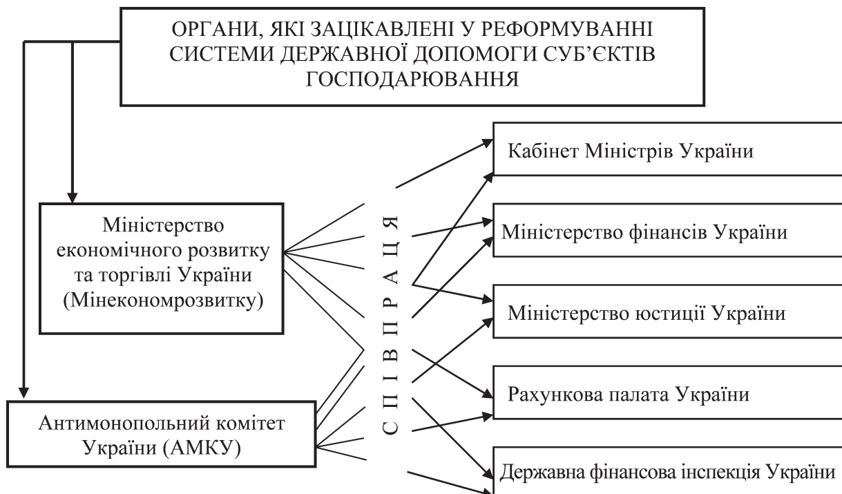
Рис. 1. Органи державної підтримки суб'єктів господарювання (згруповано автором за даними [5])

Основна ціль цього проекту — надати уряду, зацікавленим державним органам і установам України, громадськості початковий аналіз цілей, масштабу, основних отримувачів загальних сум державної підтримки — суб'єктів господарювання в Україні за останні роки. Аналогічних досліджень в Україні не проводилось. При цьому доцільно визначити сутність понять «державна підтримка»