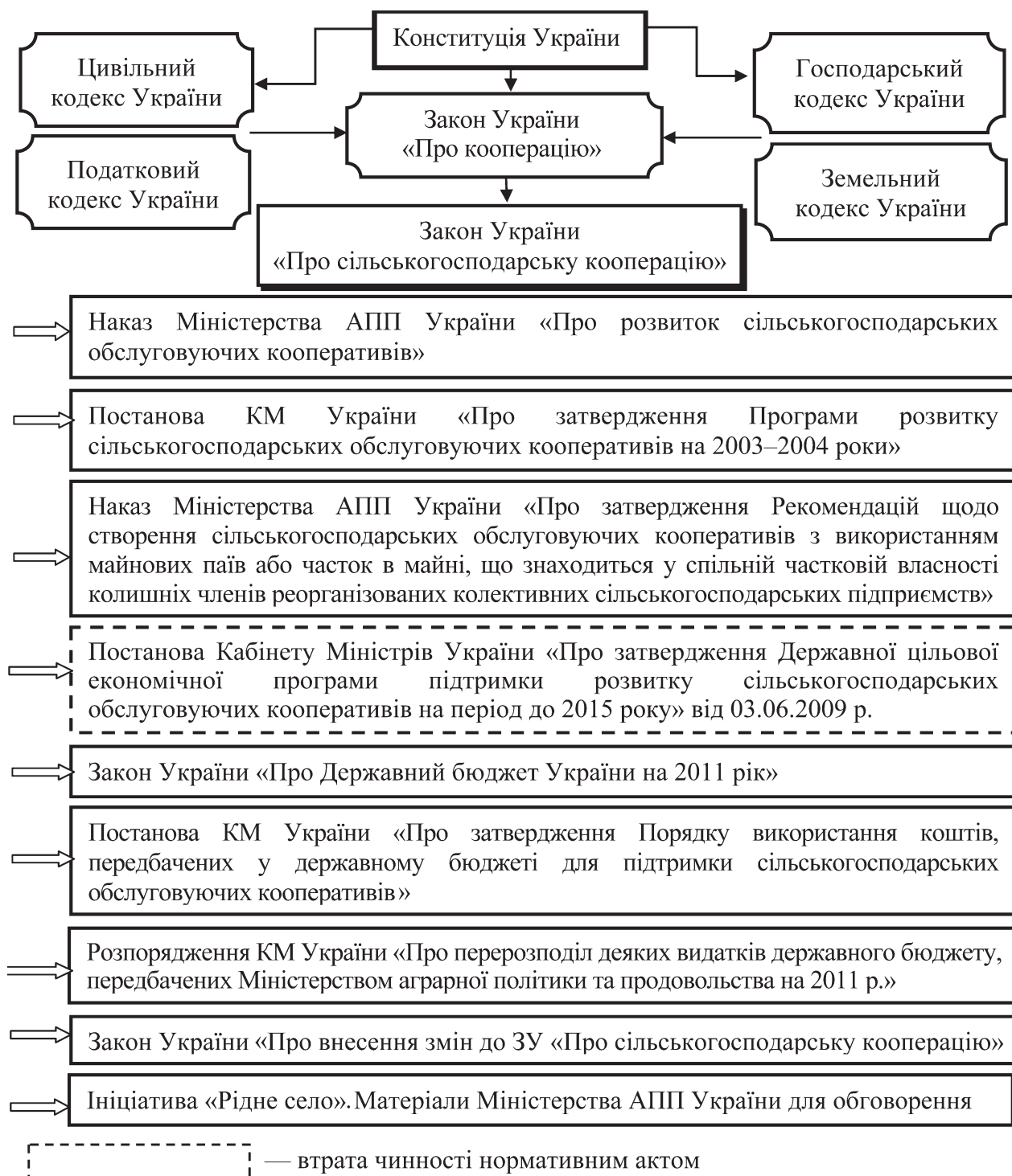
Рис. 4. Нормативно-законодавче регулювання розвитку сільськогосподарської обслуговуючої кооперації (згруповано автором за даними [12; 13; 14; 15; 16; 17])

Систему спеціального (кооперативного), зокрема аграрно-кооперативного, законодавства України на сьогодні складають Закони України