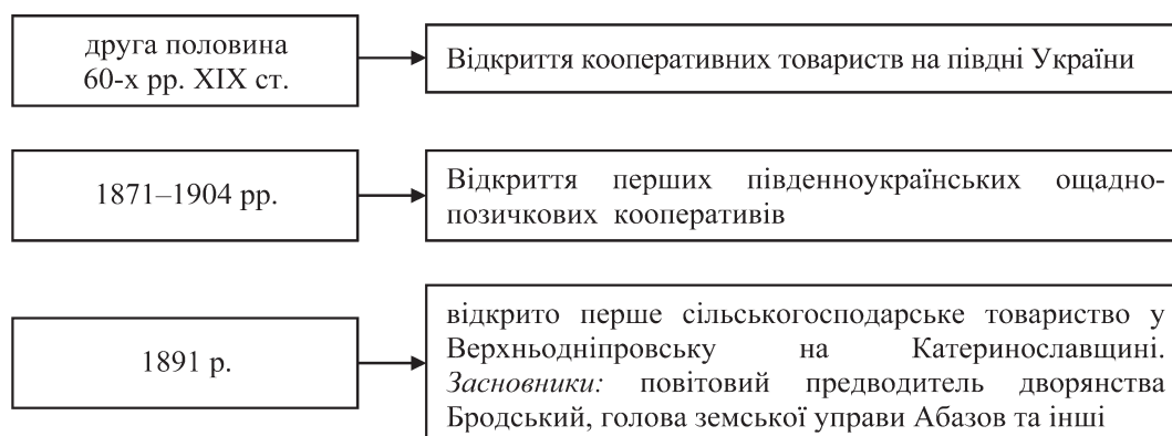
Рис. 2. Етапи становлення сільськогосподарської кооперації на півдні України

покращення сільського господарства, запровадження нових технологій і техніки на селі. Ініціаторами їх створення були представники земств, дільничні агрономи, ветеринари, вчителі. Товариства займалися організацією експериментальних полів, садів, виноградників; надавали в оренду сільськогосподарську техніку; займалися посередницькими операціями щодо закупки зерна, насіння, саджанців для селян. Існували вони за рахунок щорічних внесків членів кооперативів, відрахувань земств, прибутків від продажу продукції зі свого господарства, коштів, отриманих за надання певних послуг. Одним із перших у 1891 р. було відкрито сільськогосподарське товариство у Верхньодніпровську на Катеринославщині. Його засновниками були повітовий маршалок Бродський, голова земської управи Абазов та інші [8]. Етапи становлення сільськогосподарської кооперації на півдні України наведено на рис. 2.