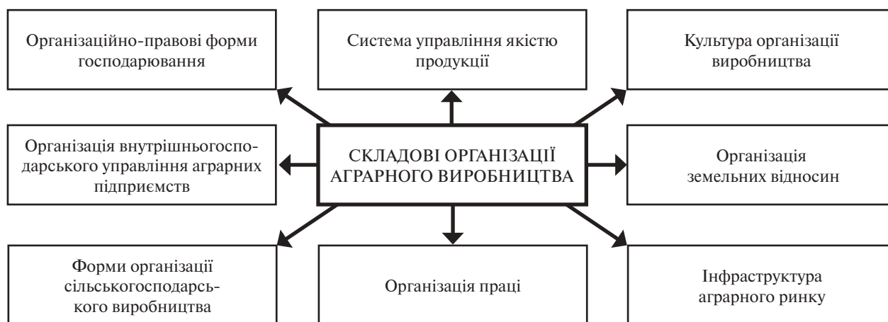
Рис. 1. Основні складові організації виробництва аграрної продукції (розроблено автором)

Складові організації виробництва відображено на рис. 1.