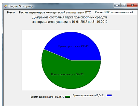
Рисунок 2 – Діаграма стану парку ТЗ за певний період експлуатації

На основі отриманих параметрів будується діаграма стану парку ТЗ за певний період експлуатації (рис. 2).