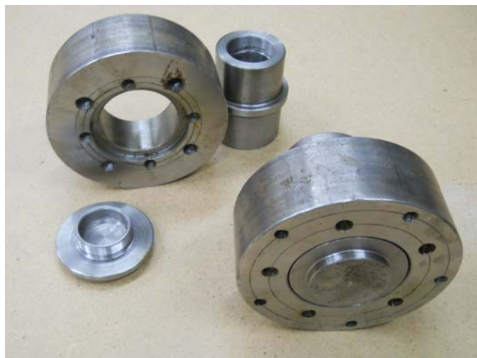
Рисунок 1 – Экспериментальный образец универсальных ступиц для одноосного прицепа

Анализ основных достижений и литературы. Кафедрой «Автомобили и двигатели» Донецкой академии автомобильного транспорта (ДААТ), на основе анализа существующих нестандартных решений [1], разработана универсальная ступица для прицепа, применение которой позволяет использовать запасное колесо автомобиля, независимо от расположения и количества крепежных отверстий на диске.