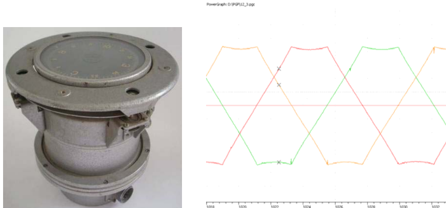
Рисунок 5 – Гіронапівкомпас ГПК-52 та осцилограма запису кута курсу

використовувався гіроагрегат автопілота авіаційної техніки – гіронапівкомпас ГПК-52 (рис.5.). Прилад забезпечує необхідний діапазон та похибку вимірювання. Для курсового кута діапазон вимірювання більше 360^{\circ} похибка \pm 0,3^{\circ} [1]. Датчиком курсового кута є кільцевий потенціометр гіронапівкомпаса.