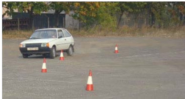
Рисунок 1 – Рух автомобіля колом заданого радіусу

2. Розмічається за допомогою конусів коло необхідного радіусу R (рис.1) з можливістю руху центра мас автомобіля коловою траєкторією радіуса R_a=20\text{м} (рис. 2) з урахуванням безпечного інтервалу. Радіус кола вибирається за рекомендаціями [1] і його значення на порядок перевищує базу автомобіля, тому в роботі прийнято R_a=OD .