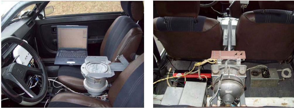
Рисунок 6 – Розміщення обладнання на автомобілі

Керування сигналами датчиків здійснюється оператором з пульта керування.