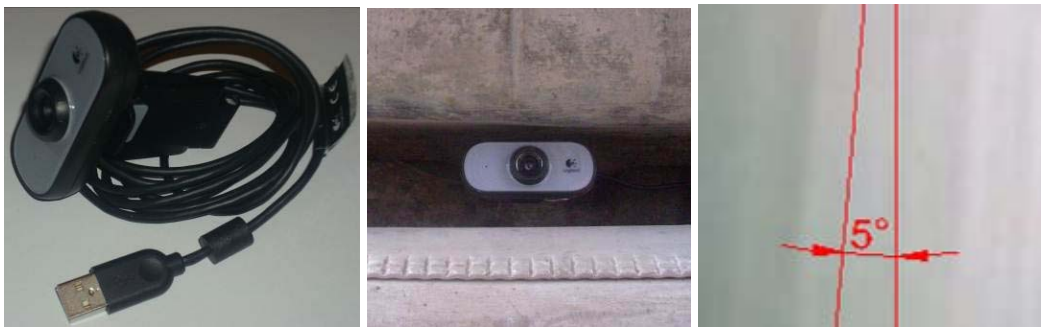
Рисунок 3 – Розміщення відеокамери на автомобілі та фрагмент запису кута відведення осі автомобіля

Визначення кутів відведення задньої осі здійснюється шляхом відео зйомки дорожнього полотна в місці горизонтальної проекції на дорогу середини задньої осі автомобіля. Щоб уникнути похибки під час розрахунків при графічному визначенні кута відведення задньої осі через кут відведення точки автомобіля в місці закріплення камери, запропоновано закріпити камеру на днищі кузова в районі середини задньої осі (рис. 3). Для відео зйомки дорожнього полотна використовується вебкамера Logitech Webcam C100, та програмне забезпечення для відеозапису.