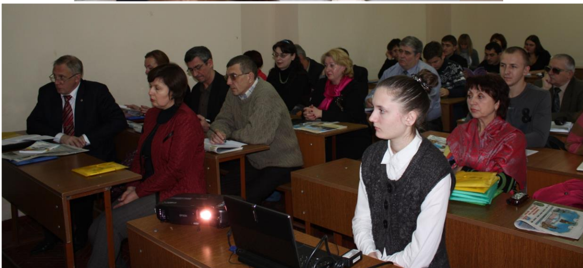
Докладчики и участники семинара «Философия и религия в поисках духовных приоритетов современного мира»