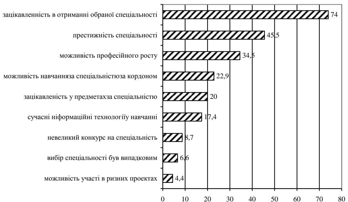
Рисунок 2 – Розподіл відповідей на питання «Що впливало на Ваш вибір спеціальності?» (у %)

ників, що визначили своє зацікавлення у вивченні соціально-гуманітарних дисциплін. Тим більше, що у порівнянні з минулими роками показники рейтингів для цієї позиції в опитуванні були значно менші. Так у 2014-2015 роках ця позиція мала 4-й ранг, а у 2016 році – він був 6-м. Стабільно, перше місце віддається знанням саме зі своєї спеціальності, а знанням необхідним для створення власного бізнесу протягом 2014-2016 років віддавалося друге місце. Базові знання з усіх дисциплін протягом 2014-2016 років мали третє місце та тільки у 2017 році знизили показник до четвертого рангу. Стабільність демонструють показники рейтингів відповідей про прагнення до занять наукою – 7 місце протягом 2014-2017 років та восьме рангове місце для відповіді про прагнення займатися наукою (за цей же період).