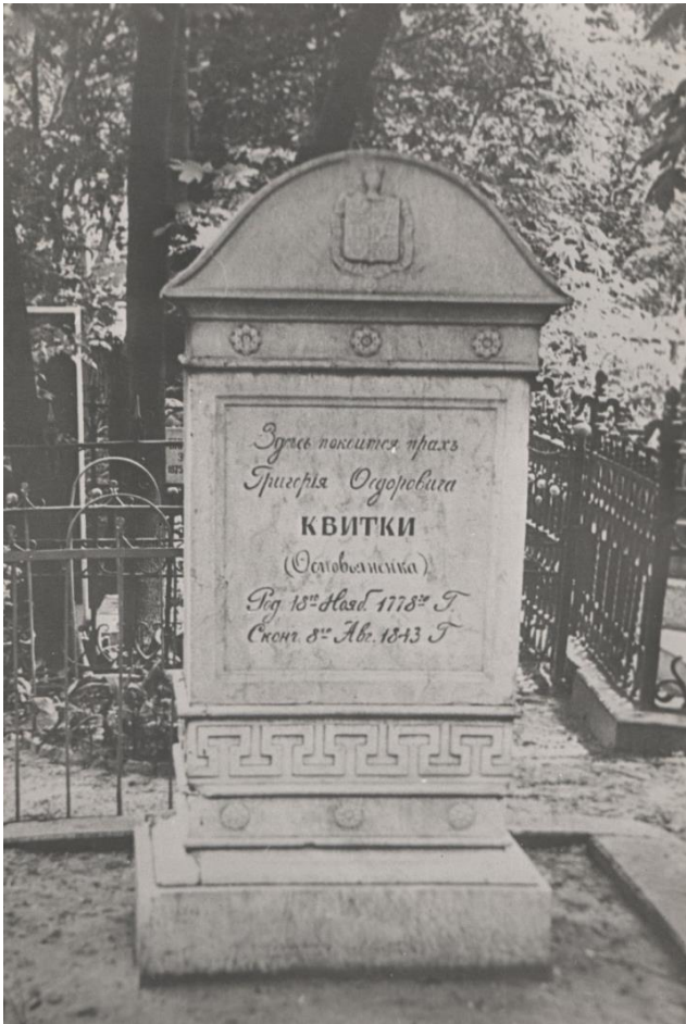
Пам'ятник Г. Ф. Квитке-Основяненко на 2 кладбище в г. Харькове

левобережної Малоросії. Род же Квиток – один із самих древніх на Слобожанщині. Він грав видну роль в історических судбах цього краю, наравне з Кондратьєвими, Лесвицькими, Теняшовими, Шидловськими і др. і уступав в цьому отношенні тільки одним Донець-Захаржевським.