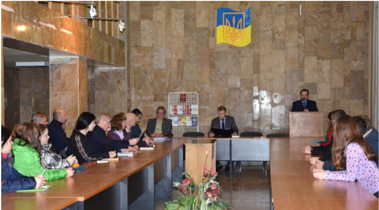
Під час презентації монографії «Національний суверенітет: український вимір в контексті світової політичної думки»

Ми сподіваємося, що ця тема знайде і в подальшому своїх розробників. На сьогодні ми свою справу зробили. Як кажуть: «Хто може, хай спробує зробити краще».