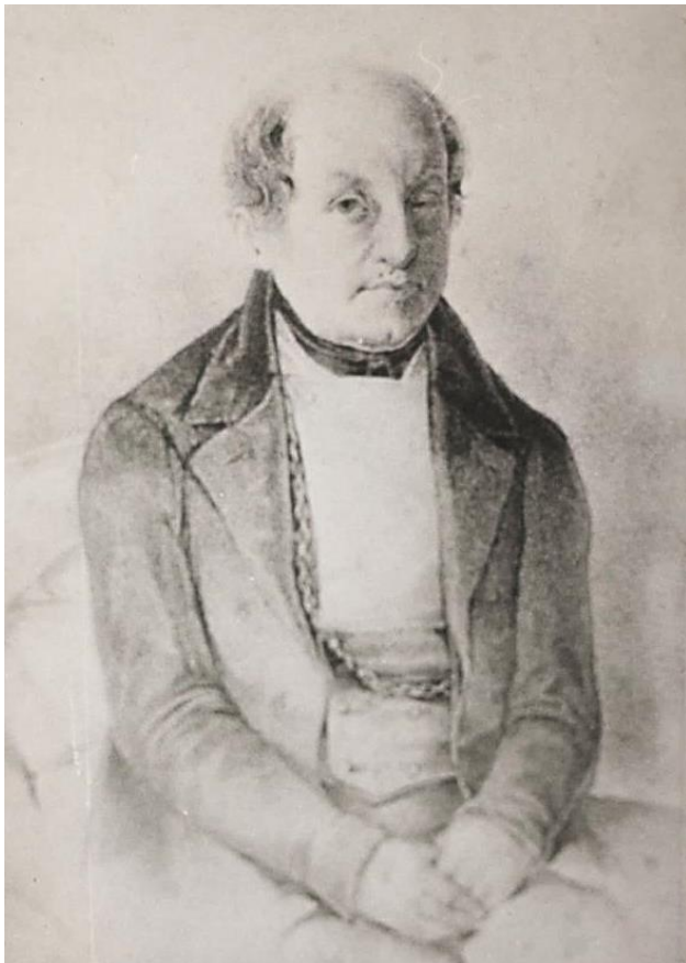
Григорий Федорович Квитка (фото со старинной гравюры)

конного полка, а в январе 1794 г. он уже в чине капитана «из оного полка по прошению отпущен». В 1804 г. он подал прошение Слободско-Украинскому и Харьковскому епископу Христофору Сулиме, в котором пишет: «... Прошу в сходстве желания моего определить меня в Старохарьковский Преображенский общежительский монастырь (Куряжский) на послушание монашеского чина...», куда он и был зачислен. В январе 17-18 числа 1805 г. Григорий Федорович присутствовал на торжествах в связи с открытием Харьковского университета, на организацию которого он положил много сил и средств, а в апреле он самовольно оставляет куряжский монастырь и возвращается домой. Наряду с В.Н. Каразиным он принимал активное участие в сборе средств на создание университета. В начале 1809 г. Григорий Федорович вместе с братом Андреем Федоровичем переезжает на жительство в Харьков в связи с избранием последнего на должность Предводителя дворянства Харьковской губернии.