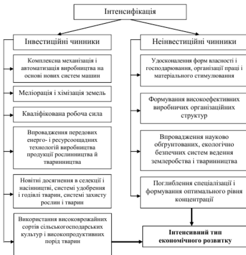
Рис. 2. – Сутність і чинники інтенсифікації [11, с.7].

На нашу думку, інтенсифікація сільського господарства – це складний соціально-економічний та екологічний процес формування інтенсивного типу економічного розвитку на основі новітніх досягнень науково-технічного прогресу через використання інвестиційних і неінвестиційних чинників. Очевидно, що співвідношення між зазначеними чинниками буде різне в окремо взятих господарствах і залежатиме від рівня розвитку останніх (рис. 2).