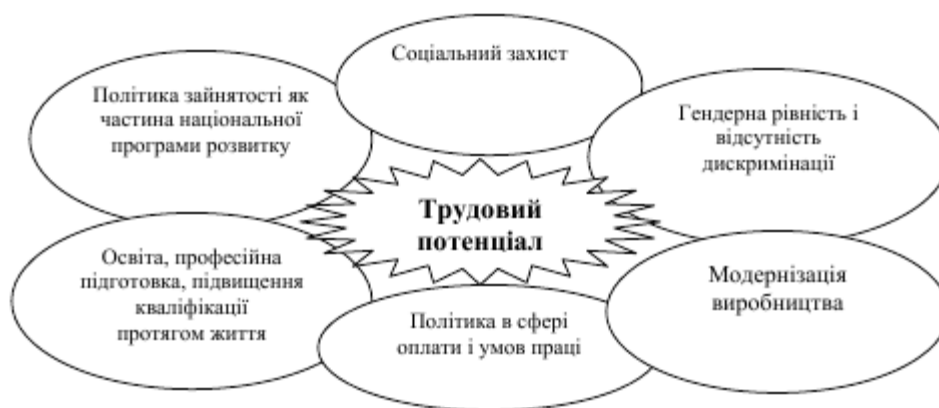
Рис. 2. – Чинники розвитку трудового потенціалу

2. Політика регулювання оплати і доходів, тривалість робочого часу і інші умови праці мають вирішальне значення для забезпечення справедливого розподілу досягнення прогресу і зростання продуктивності праці.