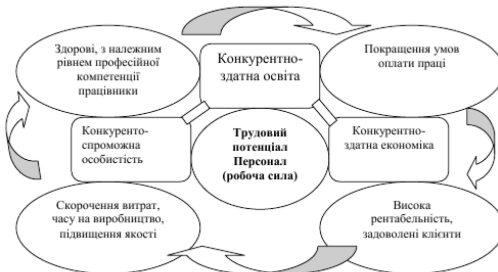
Рис. 3. – Економічна модель поваги до персоналу

покращує свої показники, результати, а працівник відчуває свою захищеність в професійних відносинах. Таким чином, навчання працівників їх захист є важливою задачею роботодавця, а держави – стимулювання роботодавця щодо даних дій. Навчання працівників не лише сприяє забезпеченню безпечності роботи, гарантує виконання вимог законодавства, а й позитивно впливає на результати виробничої діяльності.