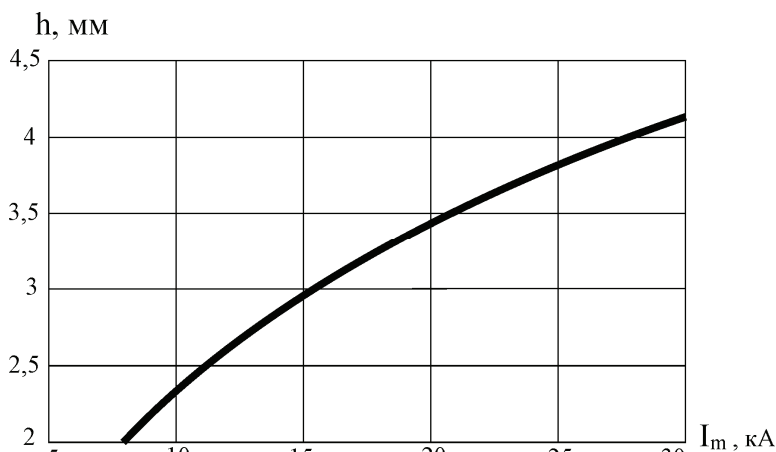
Рисунок 2 – Зависимость между амплитудой силы тока в импульсе и толщиной заготовки

кают пластические деформации, и толщиной заготовки. Как видно из графика рабочие значения величины амплитуды лежат в диапазоне 5-20 кА, так как, заготовки большей толщины (для пластического деформирования которых нужны большие величины силы тока) не являются объектами обработки для подобного класса индукторных систем [1-3]. Результаты, полученные из анализа упруго-пластического деформирования заготовки, являются необходимой информацией для дальнейшей оценки конструкционной прочности индуктора.