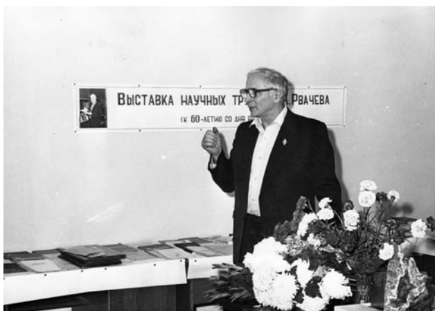
60-летний юбилей академика В.Л. Рвачева

В 1972 г. В.Л. Рвачев избирается член-корреспондентом, а в 1978 г. – действительным членом НАН Украины.