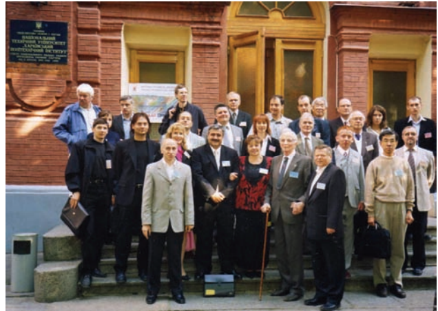
Participants of I-th International Conference "Nonlinear Dynamics" NTU "KPI", 2004

Перед глазами – жизни кадры вновь и вновь. Для оптимизма нет уже причины. Мне вечным холодом и льдом сковало кровь. От страха жить и от предчувствия кончины. Кружимся в карусели средь невежд,