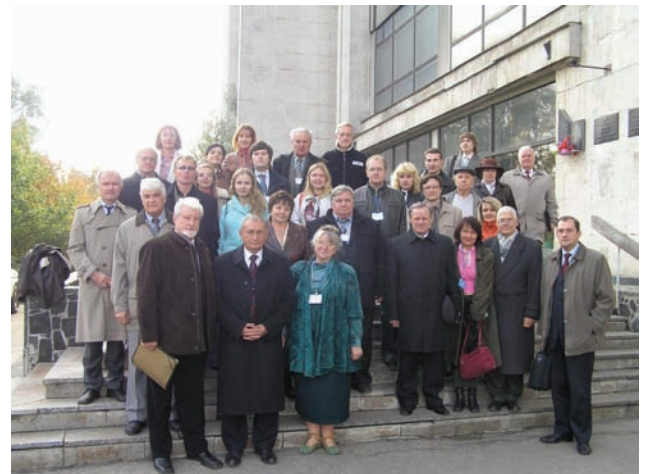
Participants of the conference "Actual Problems of Applied Mathematics and Mechanics" dedicated to the 80th anniversary of the birth of V. Rvachev, the A. Podgorny Institute for Mechanical Engineering Problems (IPMach) NAS, 2006

In 2006, an International conference dedicated to the 80th anniversary of V. Rvachev was held in Kharkov. Not only students of V. Rvachev presented their work, but also many Ukrainian and foreign scientists (from Russia, Italy, Poland, Serbia, etc.) participated in the conference.