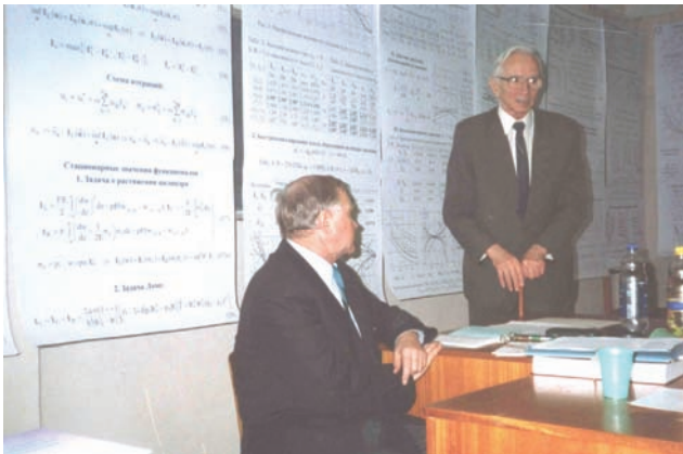
Заключительное слово председателя специализированного ученого совета в ИПМаш НАН Украины В.Л.Рвачева

В.Л. Рвачев уделял большое внимание подготовке кадров. Он являлся почетным доктором Харьковского государственного политехнического университета, Харьковского технического университета радиоэлектроники, Бердянского педагогического университета, Висконсинского университета (Madison) США.