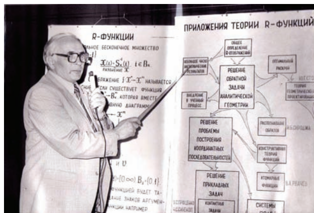
Triumphal procession of R-functions, 1985

Further development of the RFM allowed to generalize and implement the Lagrange-Taylor-Hermite formulas in functional space. Furthermore it was possible to find the new class of functions which are finite and infinitely differentiable. They are called atomic functions and play an important role in the development of the approximation theory and in the numerical methods for solving boundary problems in mathematical physics.