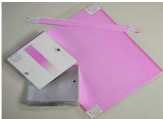
Рис. 3 – Дозиметрическая плёнка RISO В-3

У плёнки RISO В-3 (рис. 3) диапазон измерения дозы составляет 5-100 кГр, а измерение оптической плотности проводится на длине волны 554 нм ( зелёная область ). Перед измерением дозы плёнку следует прогреть при температуре 75 С в течение 5 минут. После этого дозиметрическая плёнка будет сохранять оптическую плотность (дозу) на протяжении 1 года. Плёнку выпускают толщиной 0.018 мм и разного формата. Ее калибровка осуществляется с помощью специальных калориметрических дозиметров RISO, которые являются референтными (высшего порядка) с прослеживаемостью к Национальному эталону поглощенной дозы Великобритании.