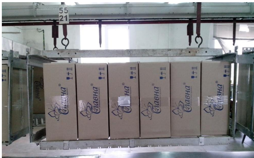
Рис. 4 – Транспортный контейнер с обрабатываемыми изделиями и дозиметром Harwell RedPerspex 4034

Для измерения дозы, получаемой изделиями при обработке, дозиметры приклеивают на поверхность ящика и/или вкладывают внутрь. После этого ящик ставят в транспортный контейнер ( подвес ) конвейера (рис.4), перемещающий его через защитный лабиринт в зону обработки пучком и обратно в зал загрузки.