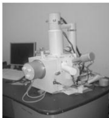
Рис. 2 – Растровый электронный микроскоп РЭМ-106И

С помощью просвечивающего электронного микроскопа высокого разрешения выявляют точечные, линейные дефекты, поры и трещины. Применяя растровый электронный микроскоп (рис. 2), атомный силовой микроскоп, сканирующий туннельный микроскоп, выявляют дислокации, поры, трещины, включения других фаз и т.д.