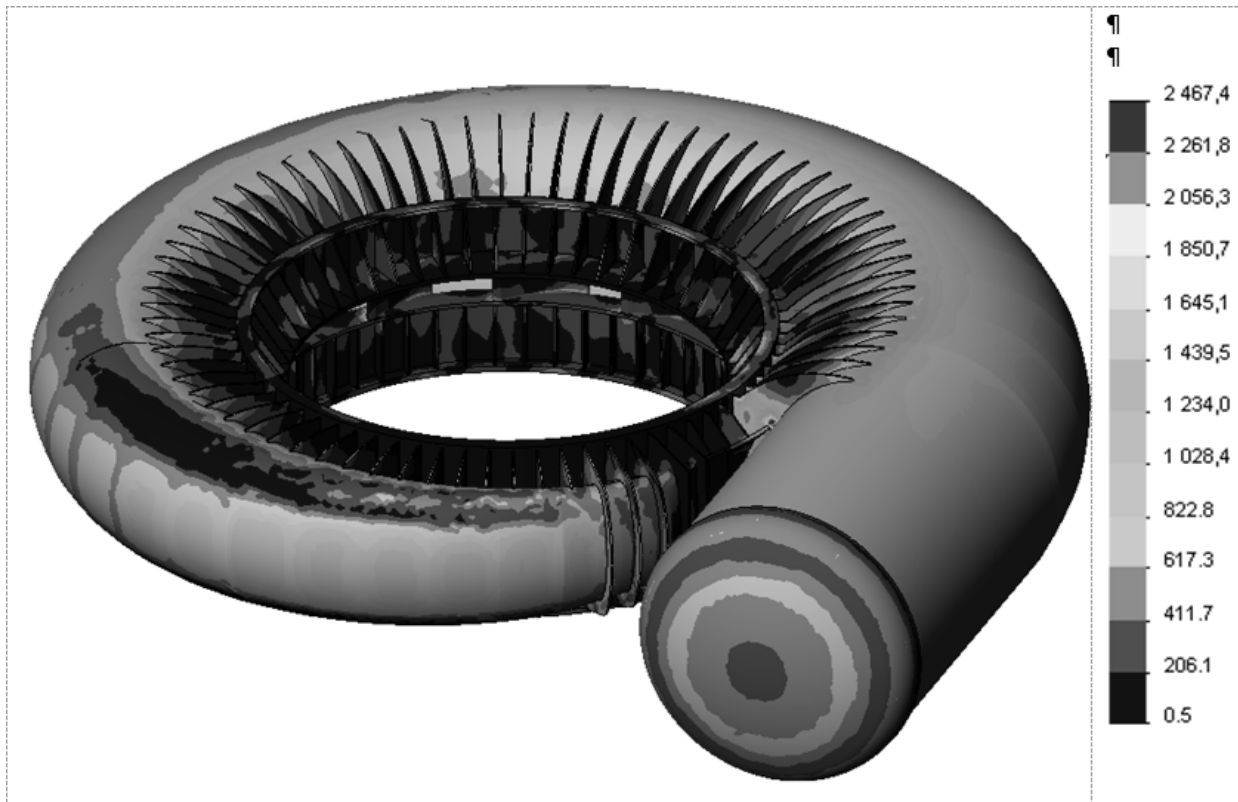
Рис. 2 – Распределение интенсивности напряжений в узле «статор-спиральная камера» при гидроиспытании, кгс/см 2