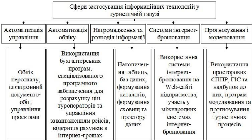
Рис. 1. Сфери застосування інформаційних технологій у туристичній галузі

інформаційні технології, спеціалізовані системи, програмні комплекси, призначені для вирішення задач прогнозування об'єктів туристичної інфраструктури та процесів туристичної галузі [3]. Вирішення такої задачі потребує створення комплексу інформаційних технологій, призначеного для моделювання та прогнозування просторового розвитку інфраструктури об'єктів туристичної галузі.