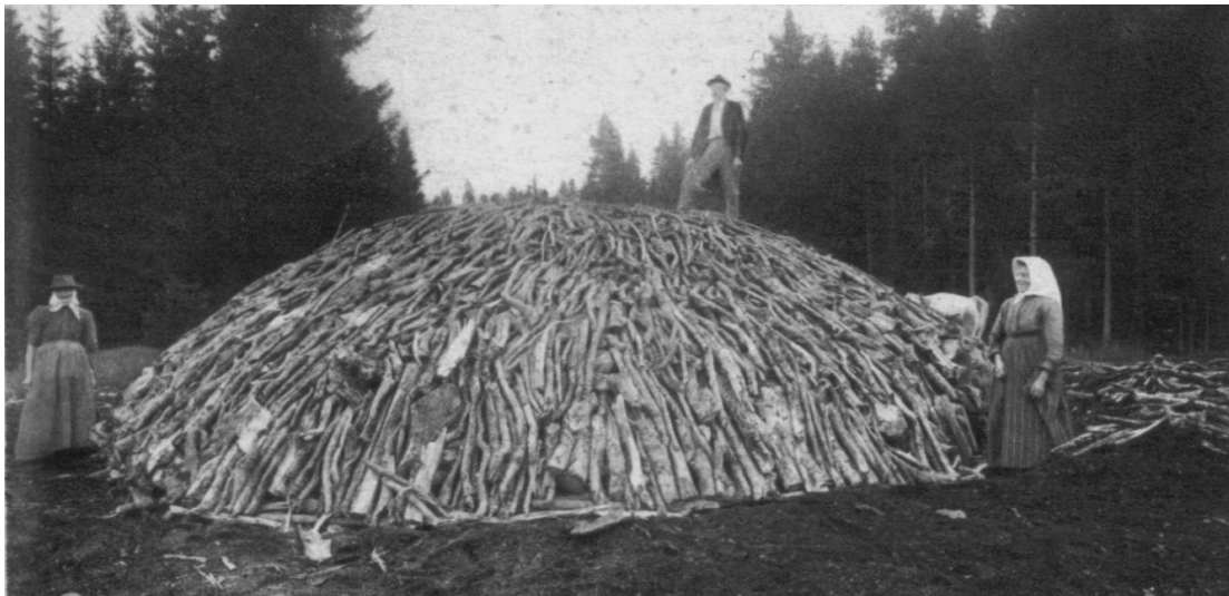
Рис. 1. Кучне вуглевипалювання

Найбільш ранніми способами добутку вважаються ямне та кучне вуглевипалювання. Технології ці були настільки примітивні, що не було необхідності у додаткових матеріалах, крім води, дров та дерну, однак за тривалістю процес міг продовжуватися впродовж 3–4 тижнів. Крім того, був необхідним постійний контроль, а продукти розпаду, які складали до 2/3 від початкової маси сухої деревини, викидалися в атмосферу (рис. 1).