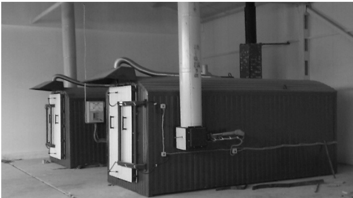
Рис. 3. Сучасна вуглевипалювальна піч виробництва ТОВ «GreenPower»

Сучасні печі мають зовсім інший вигляд та якісне технічне забезпечення, яке дозволяє отримувати великі обсяги вугілля без втрат у якості продукту (рис. 3).