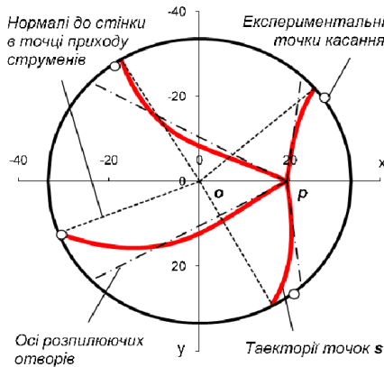
Рис. 1 – Знос паливних струменів вихором робочого тіла.

Результати досліджень. Достовірність моделі було перевірено на прикладі робочого процесу двигуна 4ЧН12/14 на номінальному режимі його роботи ( N_e = 100 кВт, n = 2000 хв -1 ). При цьому залежність \chi(\tau) є невідомою і приймалася незмінно дорівнюючою одиниці. На рис. 1 приведено розрахова-