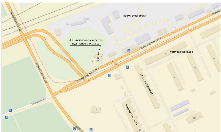
Рис. 1 – Карта-схема розміщення автозаправної станції за адресою вул. Привокзальна, 1-А

Згідно класифікації АЗС (зміна №10 ДБН 360-92) [13], по вул. Привокзальна, 1, а (рис. 1) відноситься до II категорії (середньої) за потужністю, місткістю резервуарного парку та технологічними рішеннями. Найближча житлова забудова знаходиться в південно-східному напрямку на відстані 110 м.