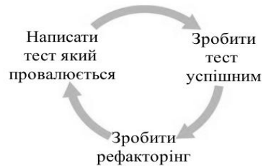
Рис. 2 – Діаграма TDD-методології

ність інфраструктур тестування, таких як TestNG, Selenium і FEST, все одно знаходиться багато причин не виконувати тестування коду. Дві звичайні причини відмови від TDD - "у нас недостатньо часу для тестування" і "код занадто складний і важко перевіряється". Іншою перепорою для програмування з попередніми написанням тестів є сама концепція "тест пишеться до коду". Більшість розглядає тестування як відчутну дію, швидше конкретне, ніж абстрактне. Досвід підказує, що неможливо перевірити те, що ще не існує. Для деяких розробників, що залишаються в рамках цієї концепції, ідея попереднього тестування - просто оксюморон (рис. 2).