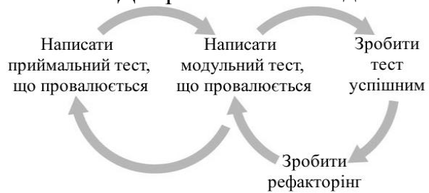
Рис. 3 – Діаграма BDD-методології

Але що якщо замість того, щоб думати в термінах написання тестів і тестування компонентів, почати думати про функціональність? Говорячи про функціональність, я маю на увазі як додаток повинен вести себе, фактично його специфікацію (рис. 3).