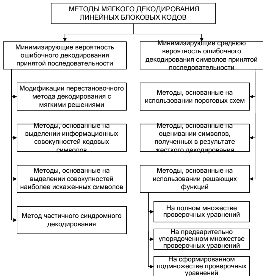
Рис. 1 – Методы мягкого декодирования линейных блоковых кодов

Основная классификация этих методов приведена на рис. 1.