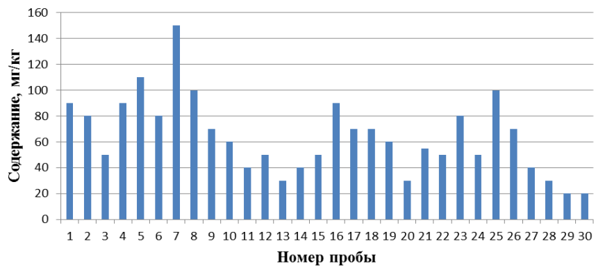
Рис. 2 – Содержание свинца в почве г. Мариуполя

Для проверки этой гипотезы было рассмотрено содержание металлов в воздухе и выбросах пыли с различным размером фракции.