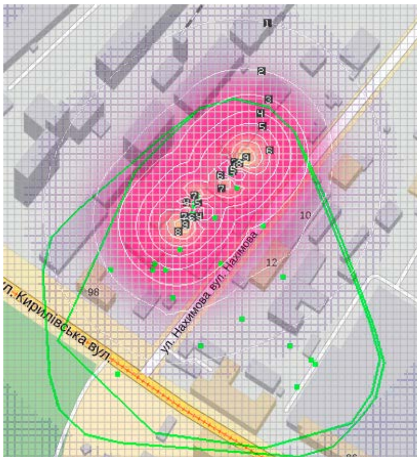
Рис. 1 – Модель розсіювання речовин у вигляді твердих суспендованих частинок та зони по часткам ГДК: 1 – 61,825 ГДК; 2 – 110,980 ГДК; 3 – 160,135 ГДК; 4 – 209,290 ГДК; 5 – 258,445 ГДК; 6 – 307,600 ГДК; 7 – 356,755 ГДК; 8 – 405,910 ГДК; 9 – 455,065 ГДК;

Результати розсіювання, щодо рівня забруднення пилом повітря джерелами викидів на прилеглий території до підприємства коливаються в межах від 61 до 455 часток ГДК. Показники свідчать про перевищення викидів. Лише на відстані у 1,5 км значення коефіцієнта К дорівнює одиниці. Таким чином навіть 9 т/рік мають величезний вплив на здоров'я людини та довкілля.