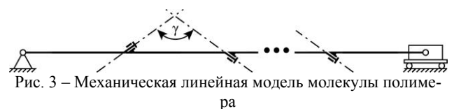
Рис. 3 – Механическая линейная модель молекулы полимера

Каждое такое звено способно совершать только вращательное движение относительно осей, проходящих через соседние звеньями элементами. Таким образом, можно провести эквивалентное преобразование, заменив трехэлементные звенья системой вращательных кинематических пар (рис. 3).