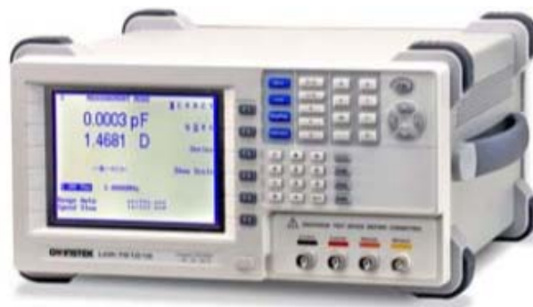
Рис. 2 – Вимірювач RLC прецизійний LCR-821 GOOD WILL INSTRUMENT CO., LTD

Достовірність формули підтверджується практичним збігом значень C для випадків розрахунку за формулою (5) при підстановці d = 0 , S = 0,01 ; l = 0,02 ;