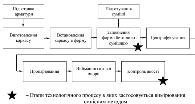
Рис. 5 – Схема технологічного процесу виготовлення опор для ЛЕП із елементами вимірювання щільності бетону

Система контролю якості продукції. Технологічний процес виготовлення залізобетонних циліндричних опор для ЛЕП досить складний (рис. 5). Якщо розглядати систему управління якістю однієї окремої опори, то вимірювання проміжних параметрів процесу за допомогою запропонованого методу можна здійснювати на етапі «Заповнення форми бетонною сумішшю», використовуючи описане вище лабораторне устаткування.