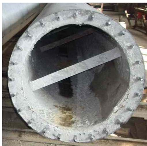
Рис. 6 – Зовнішній вигляд з торця на опору лінії електропостачання із 24 армуючими стержнями

Довжина стійок – 20 м, зовнішній діаметр – 0,8 м, внутрішній – 0,63 м. Маса виробу – до 10 т, діаметр армуючої сталі – 0,14 м.