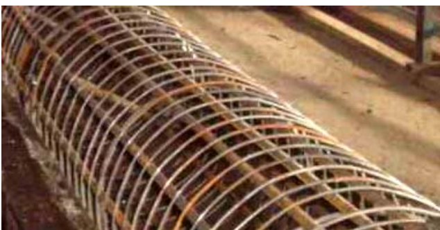
Рис. 1 – Металева арматура перед заповненням бетоном сумішшю

Проаналізуємо проблему на прикладі технологічного процесу виготовлення залізобетонних опор ЛЕП. Для початку такого аналізу достатньо подивитися, як виглядає готова арматура перед її укладанням в формуютьорючу оснастку (рис. 1).