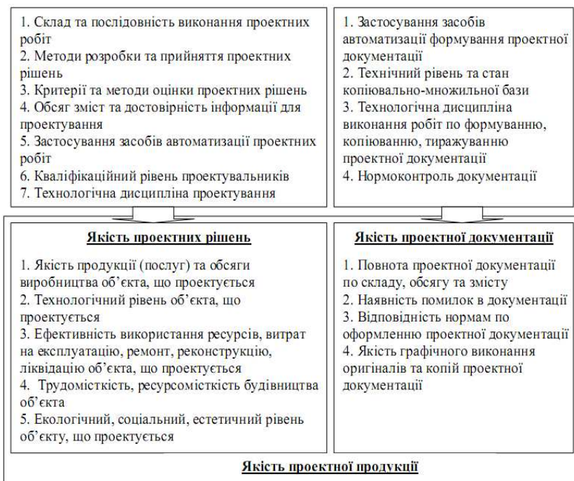
Рис.1 - Фактори технології проектування

внутрішнього аудиту процесів СУЯ; оцінки відповідності системи вимогам [3] та діючого законодавства; моніторингу та вимірювання продукції й процесів СУЯ. Як доведе практичний досвід проектних установ (серед яких ТОВ «Хімтехнологія», ДП «ІАП», ДП «Хімтехнологія»), моніторинг проекту, з метою виявлення невідповідностей, доцільно здійснювати за двома напрямками, а саме: моніторинг якості проектних рішень та моніторинг якості проектної документації (рис. 1) [4].