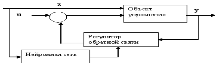
Рис. 2 - Нейронна мережа для налаштування регулятора зворотнього зв'язку

Запропонований метод контрольованого управління полягає в тому, щоб послідовно відхиляючи значення управління в різні боки, порівнювати отримані реакції об'єкта, і, залежно від того, яке з відхилень більше відповідає переходу в цільовий стан, генерувати сигнал помилки для навчання нейронної мережі.