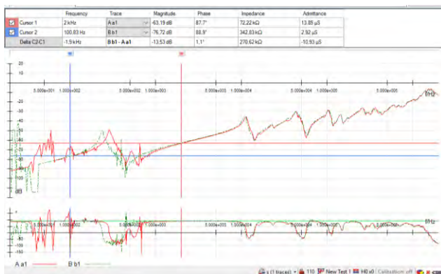
Рис. 2 – Графіки залежності діагностичних частотних параметрів трансформатора ТМ – 6300/110 від частоти (отримані шляхом використання приладу FRAnalyzer)

Тому такий трансформатор потребує подальших поглиблених обстежень з метою обґрунтування умов подальшої експлуатації та обслуговування.