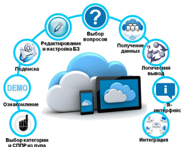
Рис. 2 – Режимы использования платформы

Таким образом, интеллектуальные СППР «облака» позволяют производить в режиме реального времени получение данных из серверов датацентра или внешних источников, рассуждения на основе правил, хранящихся в базе знаний, предоставление результатов для визуализации в естественно-языковой форме для пользователей, архивирования, выдачи в другие информационные системы. Представление знаний в системе осуществляется на основе логических моделей исчисления предикатов первого порядка, а логический вывод с использованием модифицированного метода резолюций с учетом проблемы вычислительной разрешимости. Поддерживается работа с онтологиями и вывод на них. Облачные сервисы обеспечивают наполнение, корректировку и пополнение базы знаний интеллектуальной системы в процессе ее эволюционного развития. При создании моделей знаний используется простой и удобный язык описания экспертных знаний.