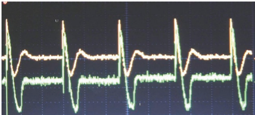
Рисунок 2 – Осциллограммы разрядного процесса импульсного источников питания, необходимого для деструкции двуокиси серы

Осциллограммы разрядного процесса импульсного источников питания, необходимого для деструкции двуокиси серы (частота следования импульсов 5 кГц) приведены на рис 2.