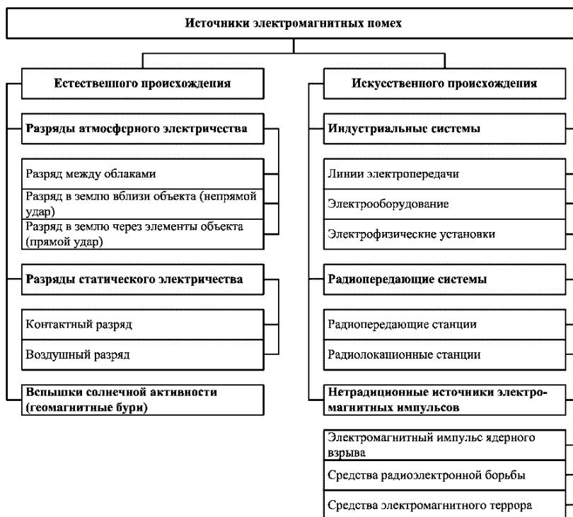
Рисунок 4 – Классификация источников электромагнитных помех

пряжения в низковольтных силовых сетях; несинусоидальность напряжения низковольтных силовых сетей; сигнальные напряжения в низковольтных силовых сетях; низкочастотные напряжения в сигнальных и контрольных кабелях; низкочастотное магнитное поле; низкочастотное электрическое поле; высокочастотные незатухающие колебания; высокочастотные однонаправленные переходные процессы; высокочастотные колебательные переходные процессы; высокочастотные колебательные электромагнитные поля; высокочастотные импульсные электромагнитные поля; электростатические разряды.