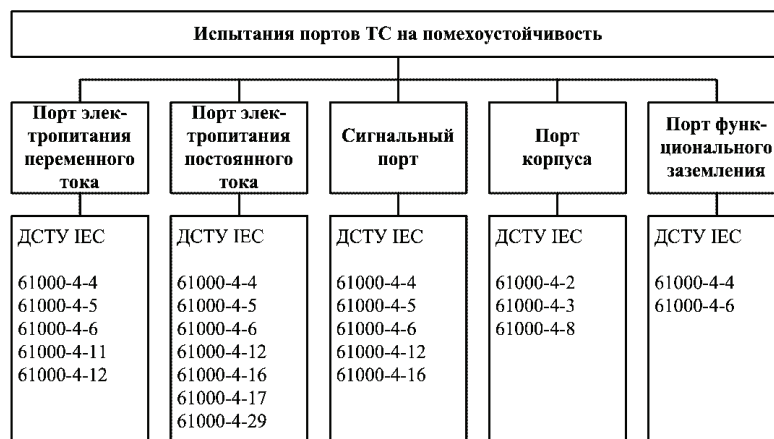
Рисунок 1 – Испытание портов ТС на помехоустойчивость

При проведении испытаний на устойчивость воздействия прикладывают к различным портам ТС. Различают пять типов портов: порт электропитания переменного тока; порт электропитания постоянного тока; сигнальные порты (порты подключения вторичных цепей измерительных трансформаторов тока и напряжения, высокочастотной связи, цепей сигнализации и управления); порт корпуса; порт функционального заземления. Для каждого порта предусмотрен соответствующий набор испытаний (см. рис. 1). Наибольшему количеству испытаний подвергается порт электропитания постоянного тока.