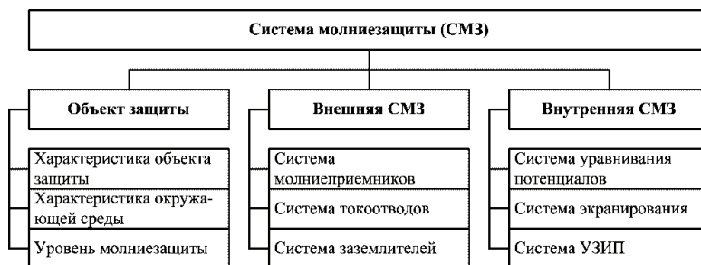
Рисунок 3 – Система молниезащиты

Защиту объекта от вторичных проявлений молнии и заноса высоких потенциалов выполняет внутренняя СМЗ, которая представляет собой совокупность электрически соединенных между собой систем уравнивания потенциалов, экранирования и устройств защиты от импульсных помех (УЗИП) (см. рис. 3).