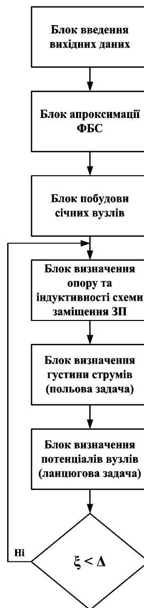
Рисунок 1 – Алгоритм роботи розрахункової частини програмного комплексу «LiGro»

– розрахувати експеримент для оцінки адекватності математичної моделі реальному ЗП як для всього ВРП, так і для окремих одиниць обладнання;